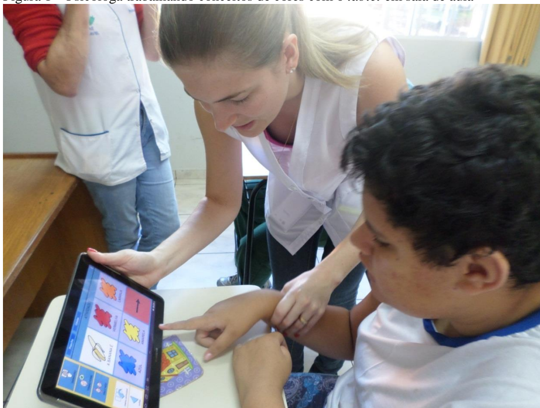
Figura 1 – Psicóloga trabalhando conceitos de cores com o tablet em sala de aula