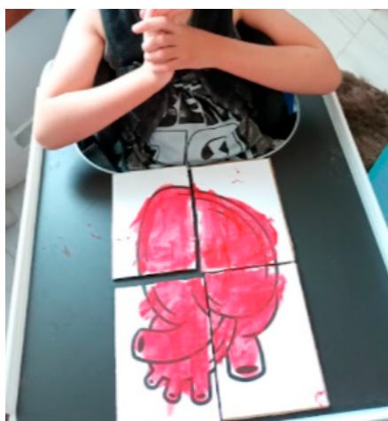
IMAGEM 3: Crianças fazendo uso dos Kits

A comunicação entre os participantes do projeto, a equipe da APAE e os familiares foi realizada por meio do WhatsApp , já que a pandemia de Covid-19 fez com que as atividades da APAE fossem, em sua maioria, transferidas para o meio digital. Dessa maneira, os kits produzidos foram disponibilizados para as famílias e, durante três sextas-feiras consecutivas (26/11/21, 03/12/21 e 10/12/21), o grupo enviava aos professores e, posteriormente, aos pais, o vídeo com o conteúdo e com as instruções de uso correspondentes às ferramentas dos kits . Já na reprodução das dinâmicas, os responsáveis das crianças foram instruídos a filmarem a realização das atividades em suas casas e enviarem as filmagens via grupo de WhatsApp . Esses vídeos eram acessados pelos integrantes do projeto e educadores, que realizavam feedbacks individuais, em forma de áudio, para cada criança e seus responsáveis. “Figurinhas” - ferramenta disponível no próprio WhatsApp - de reforço positivo com o rosto do Cór, personagem animado, também foram utilizadas para parabenizar os alunos pelo cumprimento das tarefas.