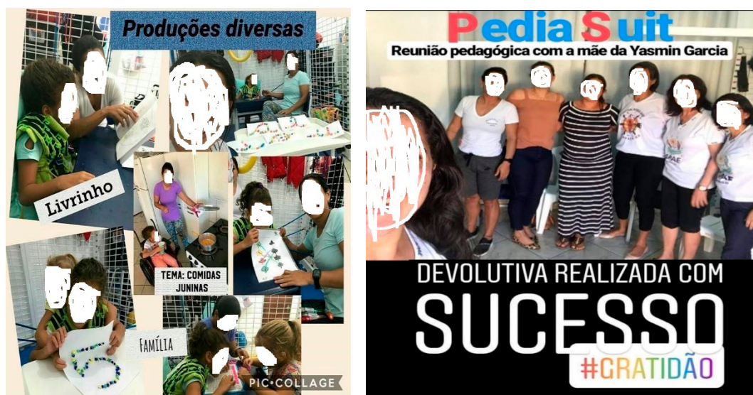
Figura 4 Produções diversas: trabalho cognitivo, motricidade fina e data comemorativa