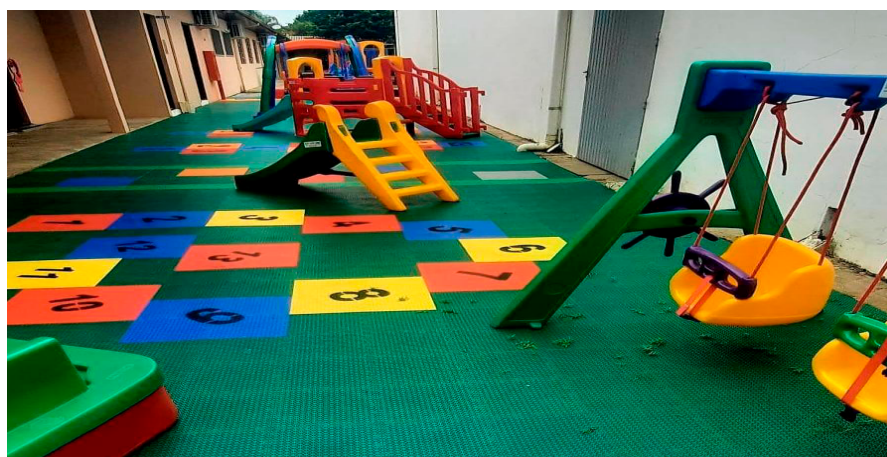
Figura 2 – Playground externo