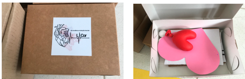
IMAGENS 1 e 2: Kits produzidos pelos extensionistas entregues aos alunos da APAE.

Já em relação aos kits produzidos, todo material foi pensado de forma a ser utilizado junto aos conteúdos abordados nos vídeos. O kit era composto por uma caixa de papelão, a qual posteriormente serviria como um tambor para as crianças treinarem diferentes frequências cardíacas; duas bolinhas de isopor para serem anexadas por um adulto a uma ponta de lápis, servindo de baquetas; dois quebra-cabeças do coração para serem coloridos, os quais foram confeccionados em papelão de modo a auxiliar no manuseio pelas crianças; uma bexiga em formato de coração preenchida com amido de milho como forma de criar um objeto fácil para a criança apertar, simulando a contração cardíaca; um coração de cartolina e palitos de picolé para as crianças montarem seus próprios “Cór’s”; e, por fim, cartilhas para colorir 9 .