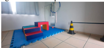
Figura 1- Sala da psicomotricidade

Inicialmente o serviço começou a ser realizado no ginásio esportivo. A partir de avaliações constantes, mapeamos algumas necessidades e dificuldades enfrentadas no uso daquele espaço. Assim, foram feitas algumas divisões no ginásio utilizando biombos e tecidos, o que permitiu diminuir o número de informações visuais que influenciavam negativamente o atendimento. Contudo, essas adaptações não foram suficientes para dar conta de receber os educandos e atendê-los da forma adequada, a partir de suas subjetividades. Deste modo, no decorrer do ano letivo, a instituição reconheceu a necessidade e a contribuição desse serviço para o desenvolvimento das crianças e viabilizou uma sala específica para o trabalho da psicomotricidade. O novo espaço oferece iluminação e ventilação favorável e dispõe de objetos tais como: espelho, tatame e playground emborrachado, mesas e cadeiras infantis, além de recursos pedagógicos variados. Além da sala de aula, a professora também utiliza o jardim sensorial, o playground externo e área de lazer para realizar as atividades. A partir da necessidade de cada educando, também são confeccionados recursos utilizando materiais recicláveis.