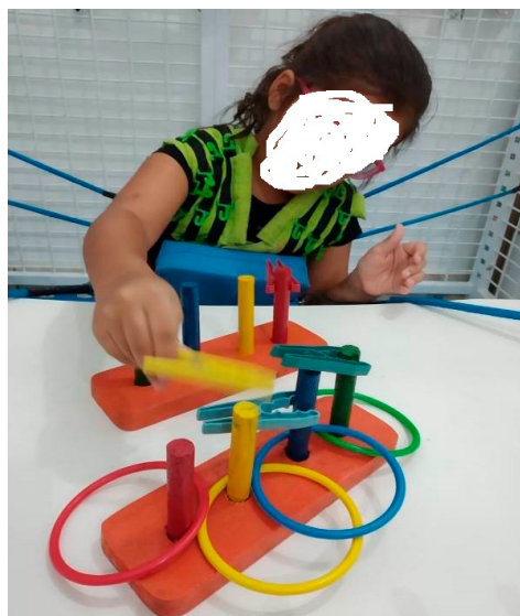
Figura 3 Motricidade fina com associação de cores